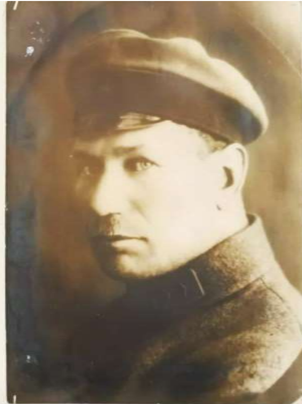
ШЕТИНКИН Пётр Ефимович. Командир полка парти- занской Армии (1885-1927 г.г.)